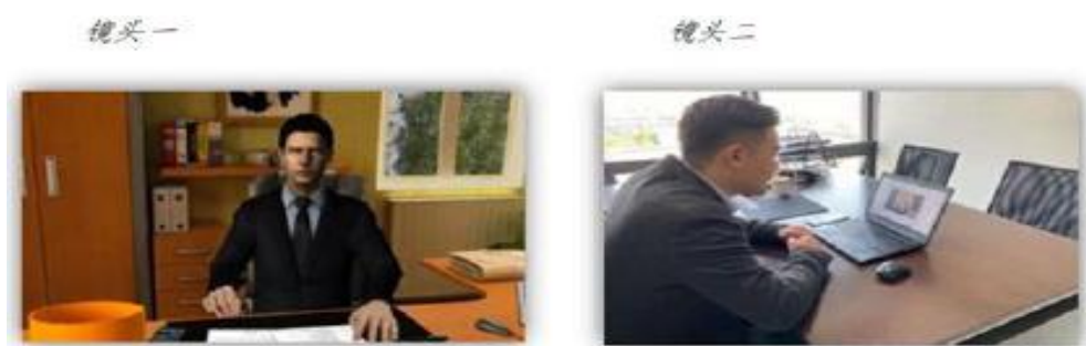
双机位模式示意图

1. 硬件准备和调试: 本次面试考生端采用双机位模式(如下图所示), 即需要两部可联网带摄像头的设备, 手机或电脑均可; 一台设备(主机位)从正面拍摄, 与面试专家进行视频; 另一台设备(副机位)从考生侧后方拍摄(置于考生侧后方成 45^{\circ} 拍摄, 要保证考生面试时屏幕内容能清晰呈现在面试专家的可见画面中); 或两台智能手机; 或两台带摄像头、麦克和音箱的电脑。